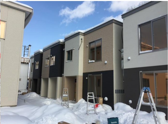
※間取図面と現状が異なる場合、現状を優先します。